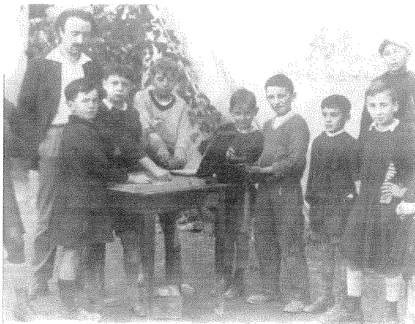
Celestín Freinet, maestro y pedagogo francés (1896-1966), creador de unas técnicas pedagógicas basadas en la introducción de la imprenta en la escuela, la asamblea, la correspondencia escolar, las prácticas cooperativas y el texto libre. Después de la Segunda Guerra Mundial, el movimiento de Freinet se consolidó, dando lugar a la escuela moderna.

Venimos a recordar hoy aquí a un maestro y a un grupo de maestros que, desde diferentes lugares de España, tuvieron la suerte de vivir años de inquietud y esperanza. En nuestro país, la llegada de la Segunda República asumió para muchos de estos maestros una significación trascendental, por la convicción de que el éxito de su instauración dependía de su cooperación con amplias capas de la población, eso podía realizarlo de forma eficaz una escuela que estuviera al servicio de las clases populares.