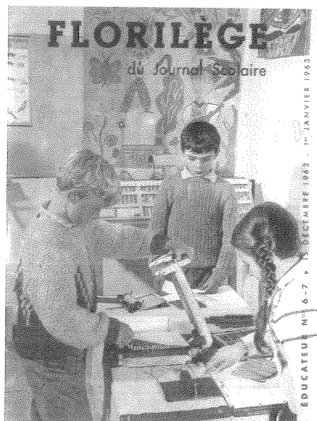
Portada de la revista «Educateur», de diciembre de 1962, en la que se aprecia a unos escolares manejando una imprenta escolar.

Freinet, desde su llegada a la escuela, no para de buscar alternativas para realizar su trabajo en condiciones óptimas que faciliten el aprendizaje de los alumnos. Así fomentará el «texto libre» -que será la fuente del trabajo de lenguaje- y el aprendizaje de la lectura -circuito natural de la unión del pensamiento y la vida-, con la «impresión escolar». De aquí se dará paso a la teorización sobre trabajo y juego; la «correspondencia escolar» será el principio de la colaboración entre los alumnos y maestros y dará después origen, al intercambio entre los maestros y al nacimiento de la «cooperación educativa».